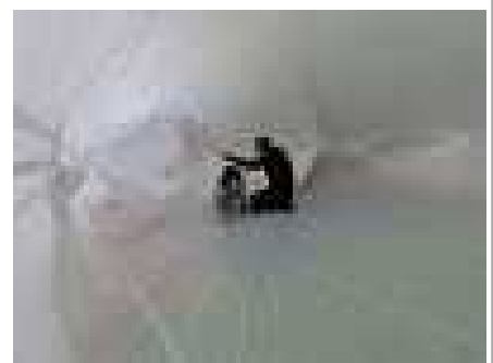
くじらの口から入って…