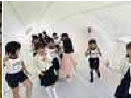
来入児と一緒にくじらの中へ