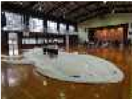
くじらの上で「YUME日和」

今年度も七歳合同祝がありました。1年生がアトラクションとして「くじらぐも」の音読劇と「YUME日和」を歌いました。写真のように大きなくじらも登場し、最後は、来入児の子どもたちもくじらの中に入って、楽しみました。