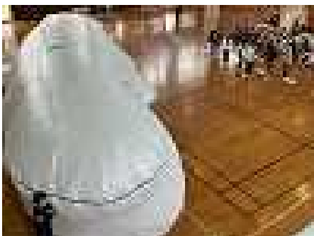
全長15mのくじらが体育館に