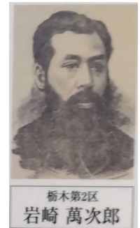
憲政記念館展示資料より