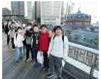
丸の内KITTEから東京駅を眼下に