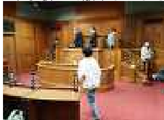
憲政記念館での議事場体験 (木札を使って記名投票を体験)