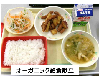
オーガニック給食献立

12月17日にオーガニック給食(有機栽培食材を利用した給食)が実施されました。町より真瀬宏子町長様をはじめ、関係者の方が来校し各教室で会食しました。自然の恵みを生かした体にやさしい有機米や野菜を美味しくいただきました。