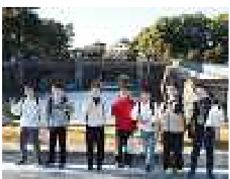
皇居二重橋の前で