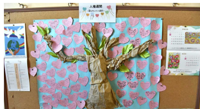
「人権コーナー」友達への感謝のメッセージカード ハートの花で満開になりました...

国連の定めた12月10日の「世界人権デー」にちなんで、日本では毎年12月を人権月間としています。佐川野小学校でも、人権週間として様々な活動に取り組みました。これからも一人一人が大切にされ、安心して学校生活が送れるような思いやるあふれるクラスづくり、学校づくりに取り組んでいきます。