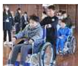
車椅子体験(5・6年生)