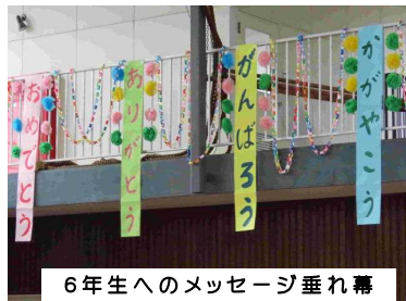
6年生へのメッセージ垂れ幕