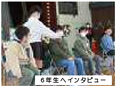
6年生ハインタビュー

送る会を乗っ取ろうとする悪者から佐川野レンジャーが6年生と力を合わせ、みんなを救ってくれました。