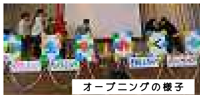
オープニングの様子

送る会を乗っ取ろうとする悪者から佐川野レンジャーが6年生と力を合わせ、みんなを救ってくれました。